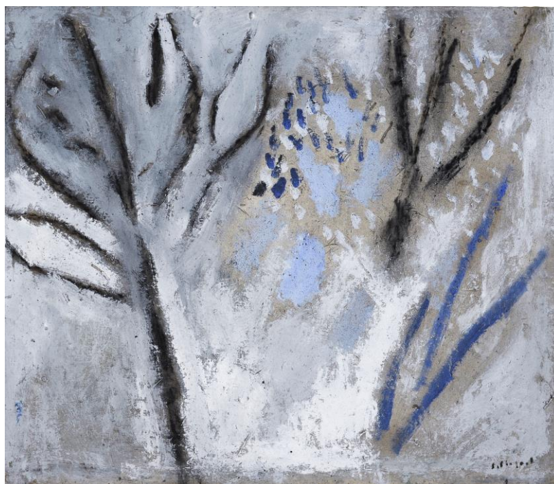
La musique des branches -Huile sur toile et pigments- 2008-1,80x1,80m