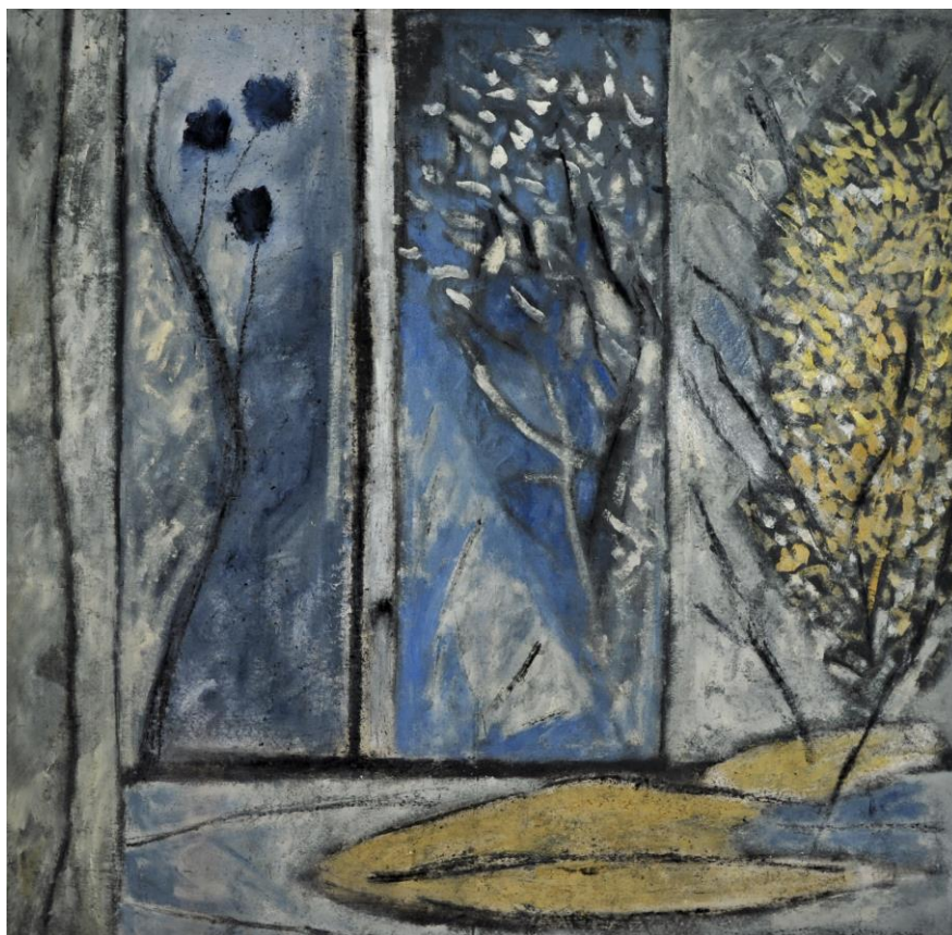
Fenêtre gris-bleu -huile sur toile et pigments- 2008-1,90x1,90m